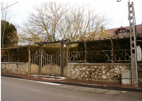
Une clôture à ciment faux-bois

Les avis seront cohérents avec ceux émis ces dernières années, à savoir : pas de maisons à volume compliqué (type V, W, Y, ou Z), pentes à 45° pour les volumes principaux, ardoise ou tuile plate de teinte brun vieilli, à 20u/m 2 , avec un débord de toiture de 20cm, enduit de teinte beige clair avec modénatures (au choix : chaînages, encadrement de fenêtres, soubassement, colombage...). *Voir les autres fiches.