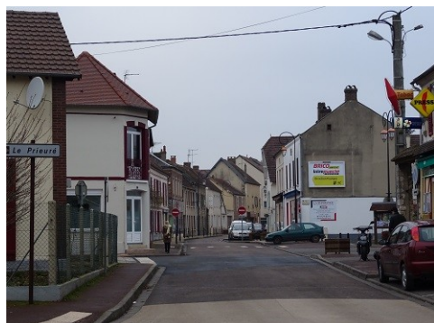
Les abords du monument