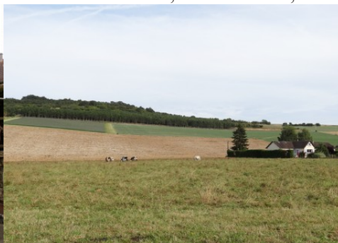
Le plateau vallonné du Vexin