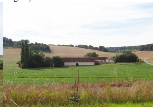
Un paysage à dominante rurale